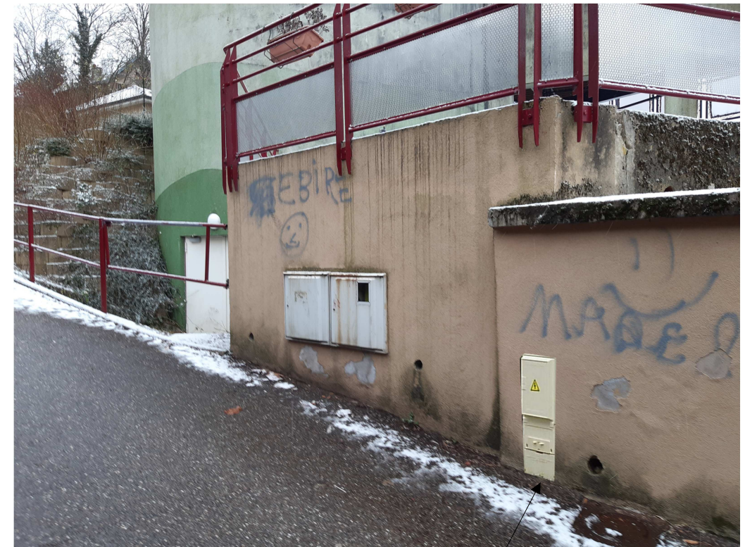
Pose 1 coffret réseau