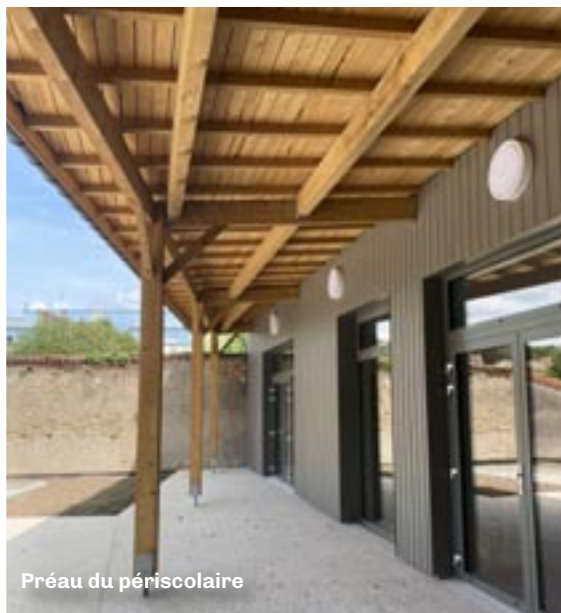
Préau du périscolaire