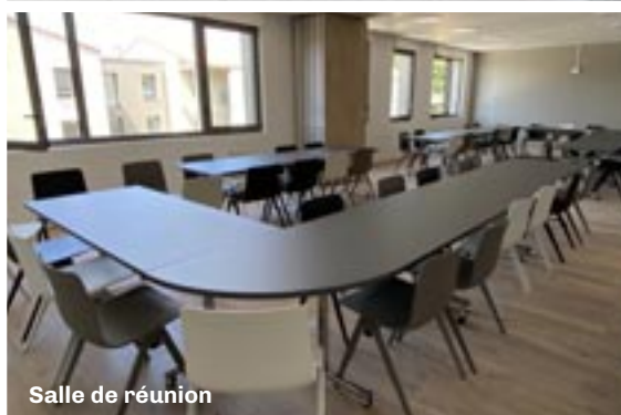
Salle de réunion

Portes ouvertes le 9 septembre. Infos à venir