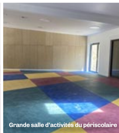
Grande salle d'activités du périscolaire