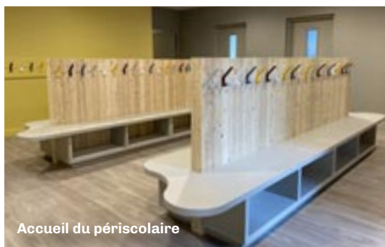
Accueil du périscolaire