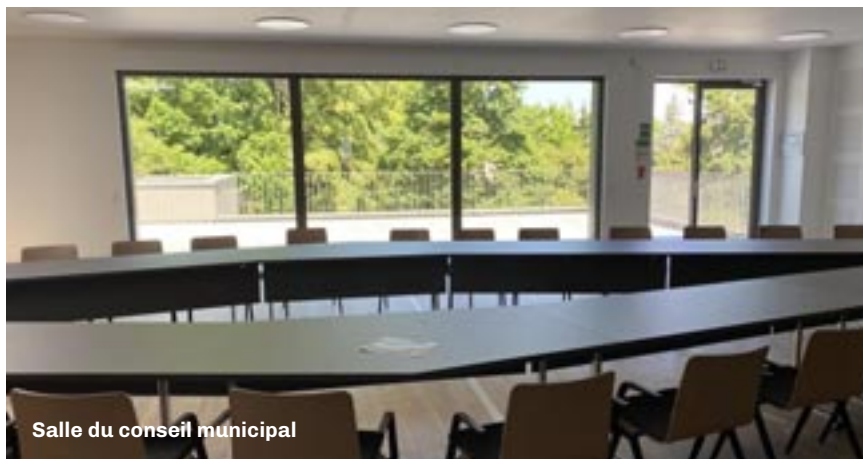
Salle du conseil municipal