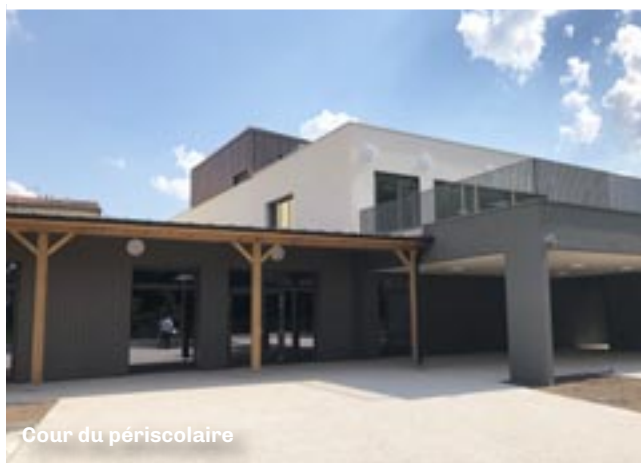
Cour du périscolaire