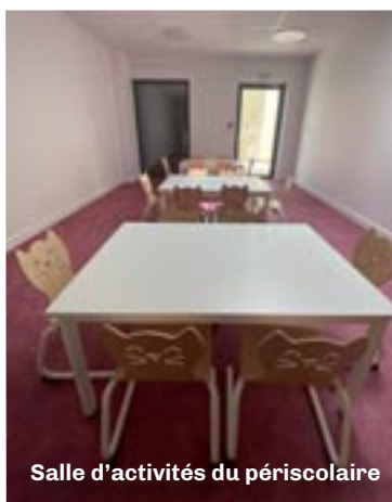
Salle d'activités du périscolaire