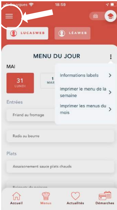
Clic sur les trois points à droite Menu déroulant avec : > menu de la semaine en PDF