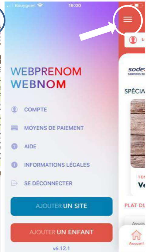
Clic sur les « trois barres » à gauche Menus déroulant avec : ➤ Compte / Mot de passe ➤ Aide et ajouts