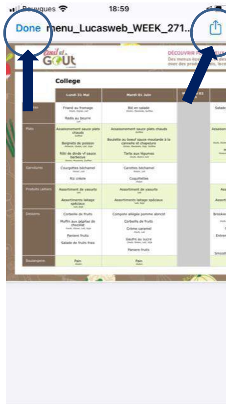
Possibilité d'enregistrer le PDF ou de le récupérer par SMS / Mail avec l'icône « carré-flèche » Pour revenir en arrière, clic sur « Done »