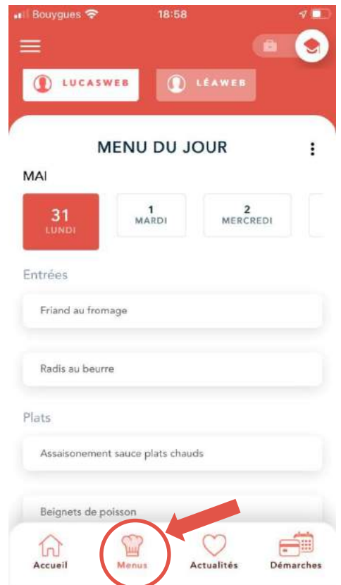
Voir le menu en cliquant sur l'icône « Toque du Chef »