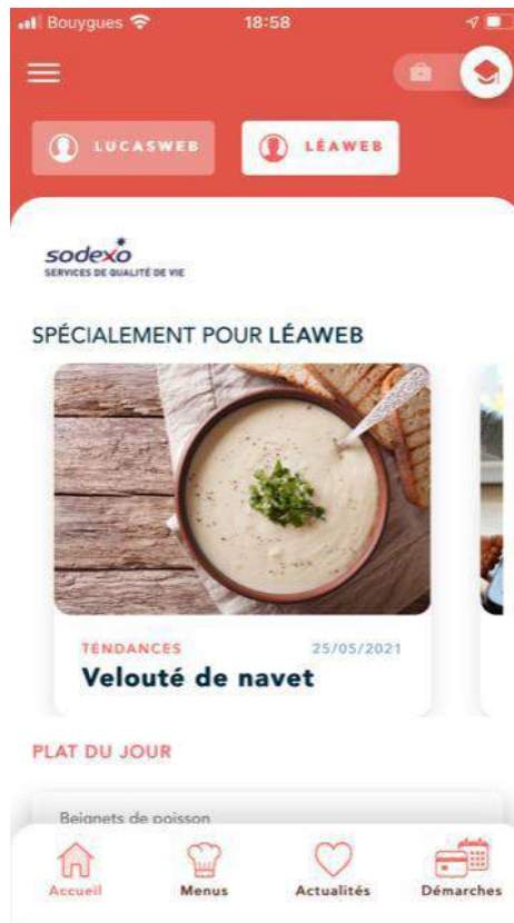
Changer d'enfant en cliquant sur le rectangle avec son prénom en haut.