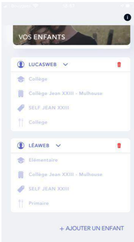
Dans cet exemple : Lucas au collège, Léa à l'école. Les 2 e et 3 e lignes sont identiques, c'est normal (établissement = Collège).